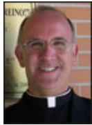
P. Antonio Rivero L.C. Formación y Espiritualidad del Sacerdote

Quiénes somos Secciones Comunidades ¡Suscríbete! Servicios Consultas en línea Eventos Alianzas Mini sitios App